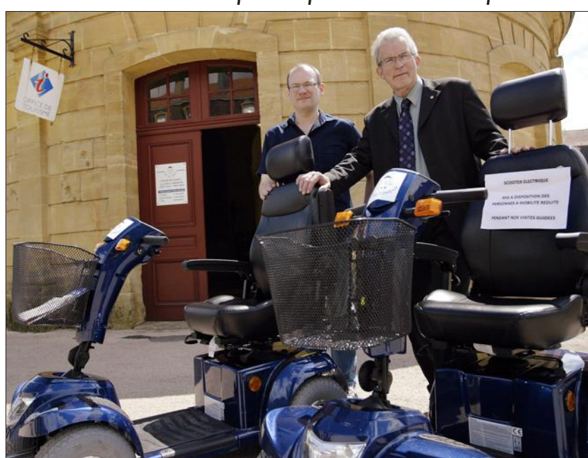
En 2015, l'office de tourisme du pays de Longwy poursuit ses efforts afin d'obtenir le label "tourisme handicap", entamés avec l'achat de ces deux scooters.

Comment se porte l'équipe de l'office de tourisme du pays de Longwy ?