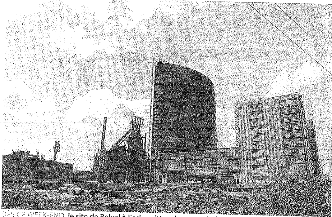
DÈS CE WEEK-END, le site de Belval à Esch quittera le statut de friche industrielle pour devenir partiellement ouvert au public.